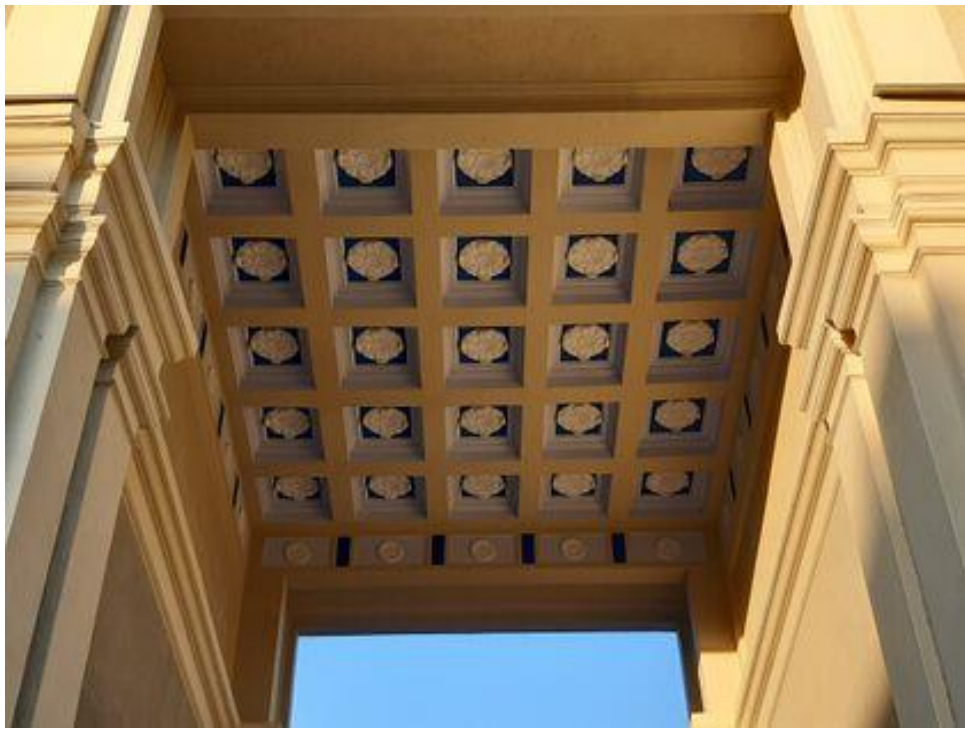
Улица Станиславского, 3.